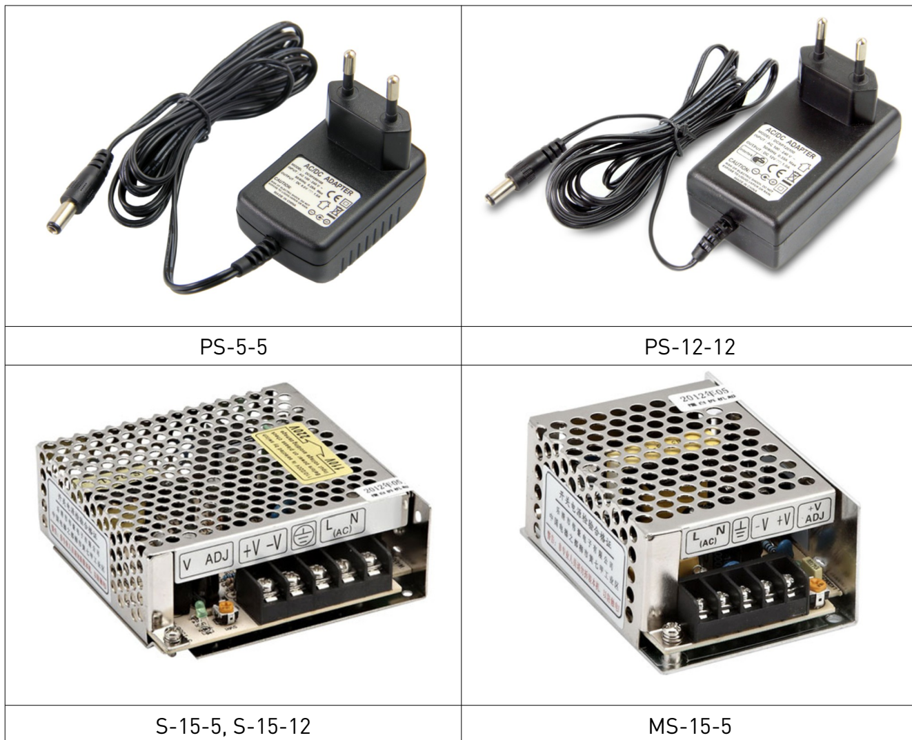
Рис. 1. Внешний вид источников питания