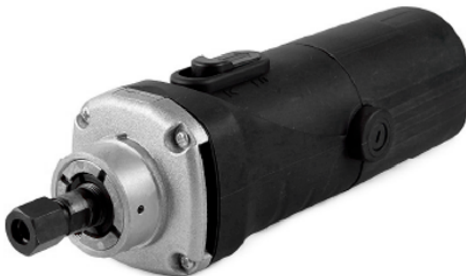
Рис. 1. Внешний вид шпинделя PL-SPD-02